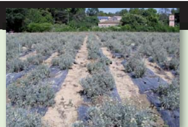
sont économiquement rentables en Europe et au Sud.

La hausse actuelle du prix du caoutchouc naturel ne peut être que bénéfique au développement de la culture du Parthenium argentatum (guayule, en photo) et au Taraxacum Kok Saghyz (Pissenlit russe) lorsqu'il aura été prouvé que ces cultures