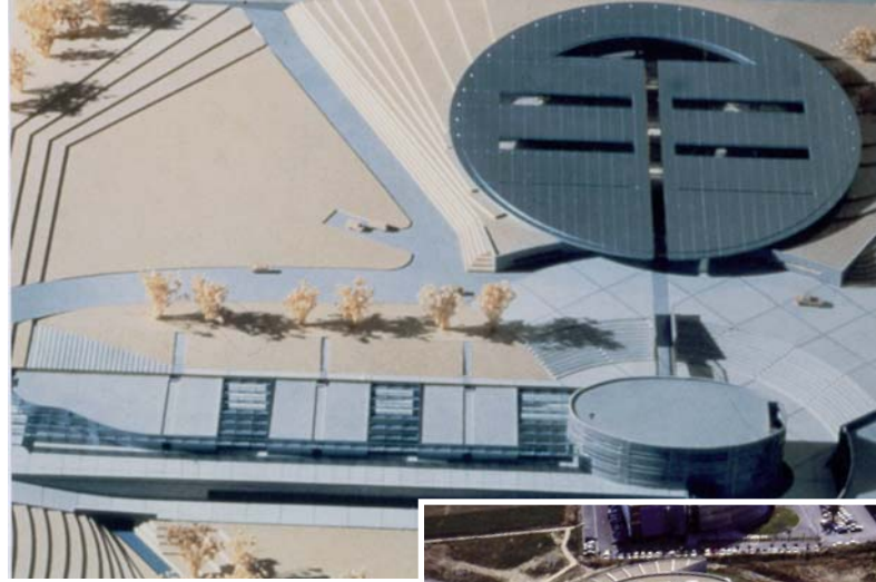
▲ 1991 : maquette d'Agropolis International et d'Agropolis-Museum