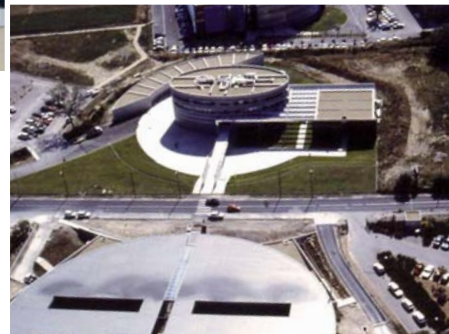
► 2011 : le site actuel

Dessiné par le cabinet montpellierain d'architecture François Fontes , avec le Conseil Régional Languedoc-Roussillon pour maître d'ouvrage, le bâtiment Agropolis International, symbolisant la clé du savoir, a été financé par l'Union européenne, la Région Languedoc-Roussillon, le ministère français chargé de la recherche. Le bâtiment appartient à la Région Languedoc-Roussillon et a été mis à disposition de l'Association Agropolis International depuis sa construction en 1992. Il confère une présence, une identité à Agropolis.