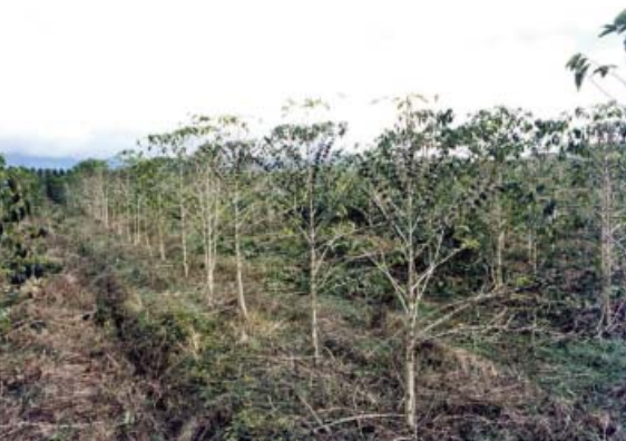
J. Avelino © Cirad