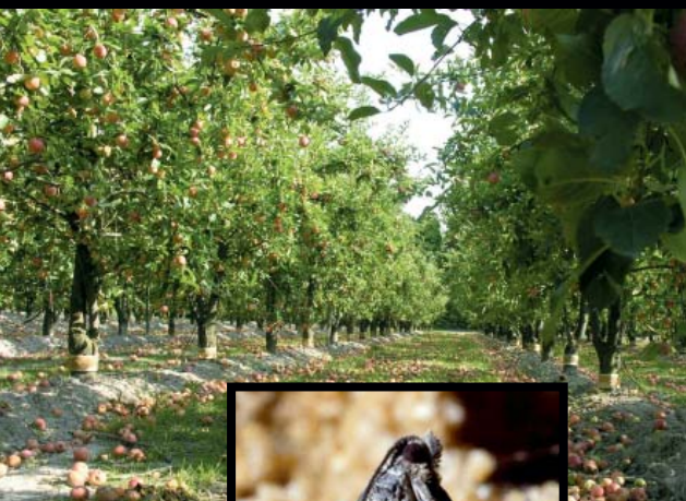
P. Franck © Inra