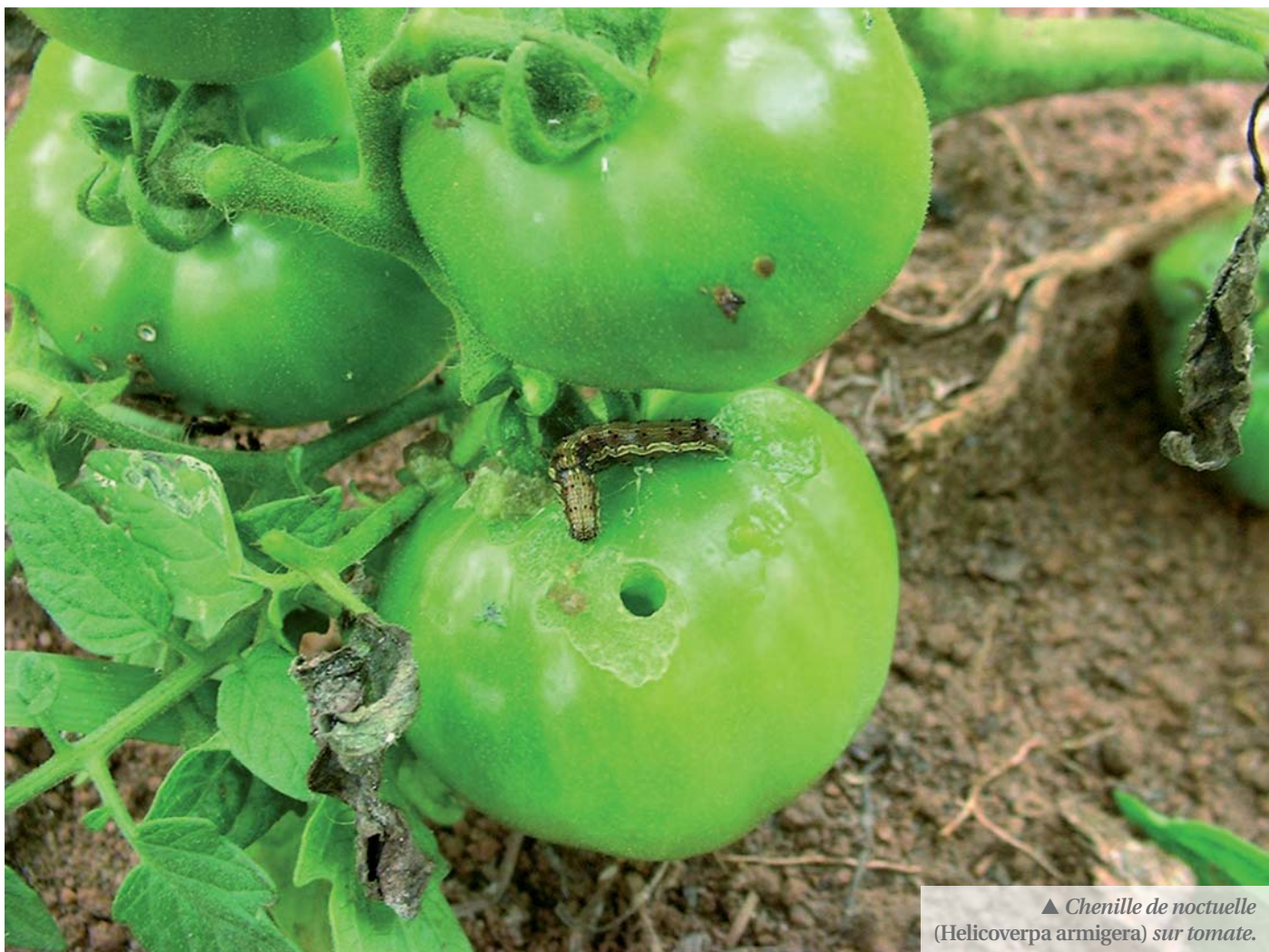
▲ Chenille de noctuelle (Helicoverpa armigera) sur tomate.